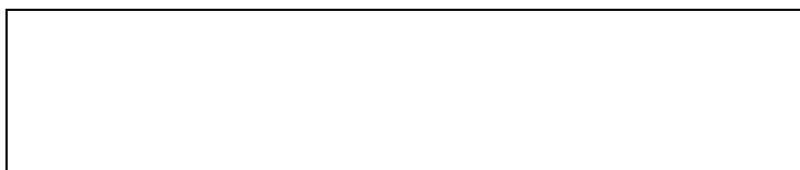
Figura XX. Breve descrição. Fonte. Autoria da fotografia (se for o caso). Data e lugar da fotografia (se for o caso)

As legendas das figuras vêm logo abaixo delas em corpo 10, centralizadas, na mesma fonte usada para o texto. Devem constar as seguintes informações: